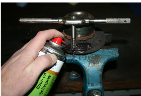
Boor- en snijoliespray

Voor draadsnijden, boren, frezen, zagen, draaien, etc. Geschikt voor RVS, staal, legeringen, non-ferrometalen en edelmetaal.