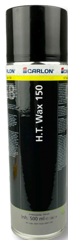
H.T. Wax 150