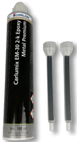
Carlumix EM-30 2-K Epoxy Metal Premium