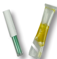
Glas- metaallijm 2-k