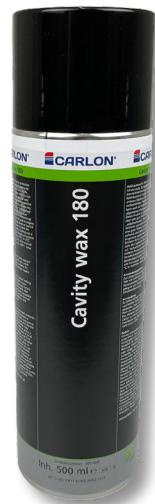
Cavity wax 180