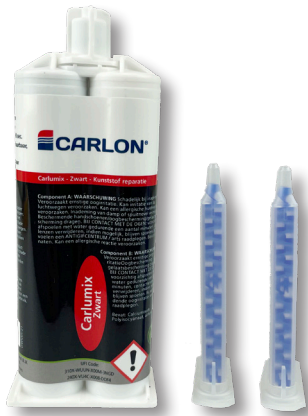
Carlumix 2-K PU Premium