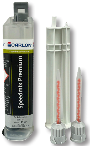
Speedmix Premium 2-K