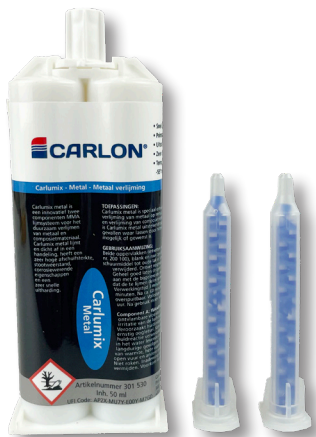
Carlumix 2-K Metal