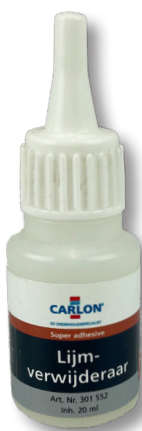
Lijmverwijderaar tbv Super adhesive

301552 Lijmverwijderaar t.b.v. Super adhesive 20ml