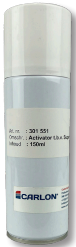
Activator tbv Super adhesive