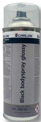
Black bodyspray glossy