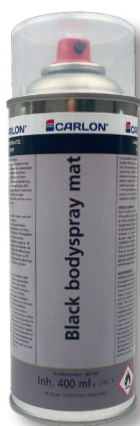
Black bodyspray mat