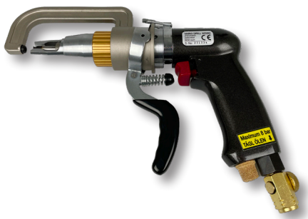
Perslucht puntlasfreesmachine Vario-Drill