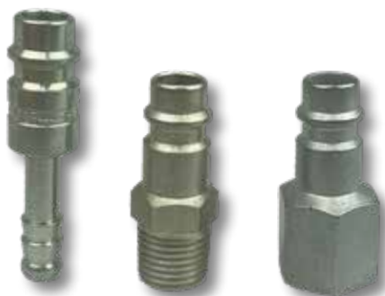
4 5 6 Insteeknippel type C/25