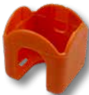
Afdekkap t.b.v. veiligheidsluchtkoppeling