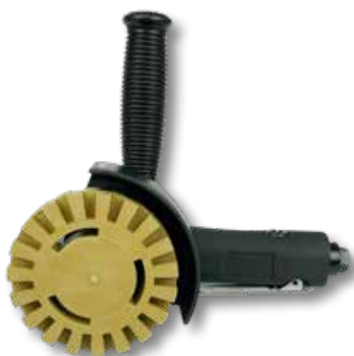
Perslucht haakse stickerverwijderaar

Art.nr. Omschrijving 701059 Perslucht stickerverwijderaar PS 34