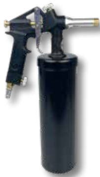
Perslucht bodembeschermingsspuit met beker PS 82

Art.nr. Omschrijving 701160 Perslucht bodembeschermingsspuit Basic PS 81