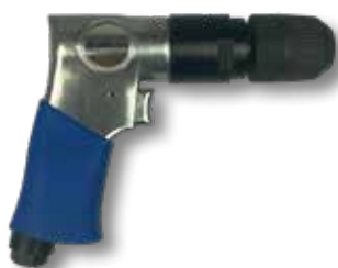
Perslucht boormachine PS 71