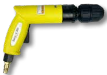
Perslucht boormachine Bana

Art.nr. Omschrijving 701025 Perslucht boormachine PS 71 L+R