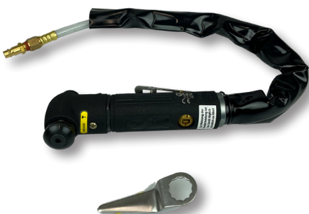
Perslucht multisnijder PS 41