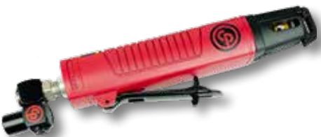
Perslucht schrobzaagmachine 7901