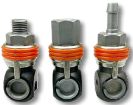
1 2 3 Veiligheidsluchtknikkoppeling C/25