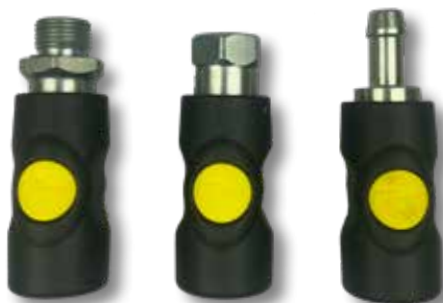
1 2 3 Veiligheidskoppeling met drukknop geel