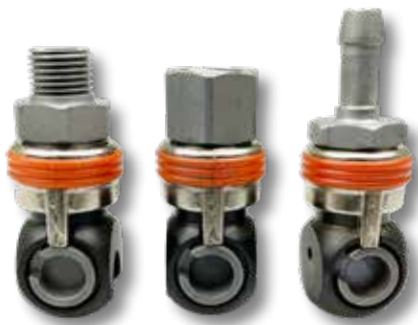
1 2 3 Veiligheidsluchtknikkoppeling A1/22