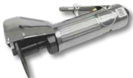
Perslucht doorslijpmachine PS 38