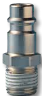
Nippel C/25 op ware grootte