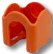
Afdekkap t.b.v. veiligheidsluchtknikkoppeling