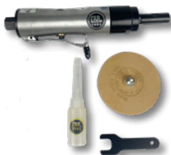
Perslucht stickerverwijderaar PS 34

Art.nr. Omschrijving 701027 Perslucht boormachine Bana