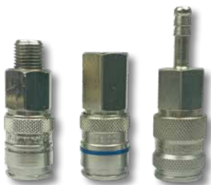
1 2 3 Luchtkoppeling type C/25