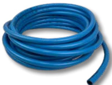
Persluchtslang Nobel air