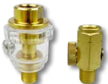
Mini-olienevelaar / luchtregelaar