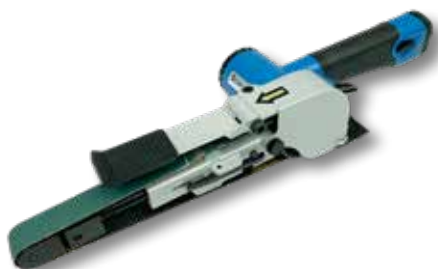
Perslucht bandschuurmachine PS 9