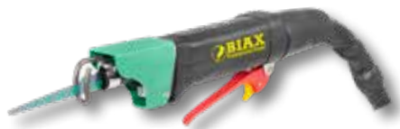
Perslucht schrobzaagmachine PLF 90