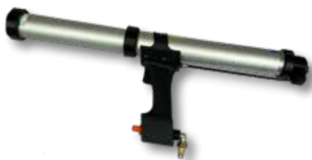
Perslucht kitpistool Junior PS 65