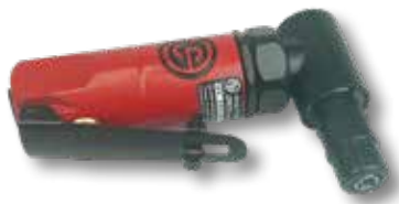
Perslucht haakse stifslipjer