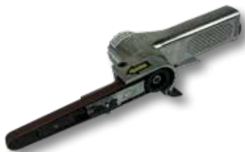
Perslucht bandschuurmachine PS 5