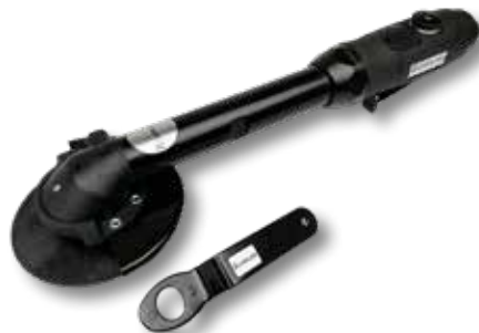
Perslucht haakse slijper lang PS 39