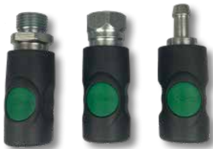
1 2 3 Veiligheidskoppeling met drukknop groen