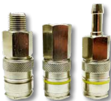
1 2 3 Luchtkoppeling A1/22