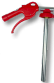
Perslucht bodembeschermingsspuit Basic PS 81

Art.nr. Omschrijving 900047 Perslucht structuurspuit