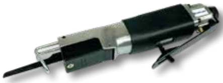
Perslucht schrobzaagmachine PS 12 basic