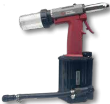
Perslucht blindklink nagelmachine

Art.nr. Omschrijving 701162 Perslucht bodembeschermingsspuit met beker PS 82