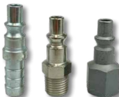
4 5 6 Insteeknippel A1/22